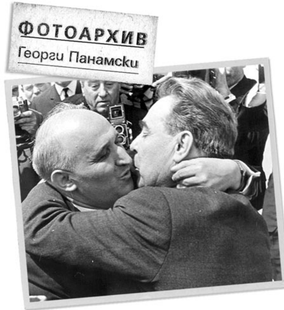
Целувка от векове за векове – Тодор Живков и Леонид Брежнев