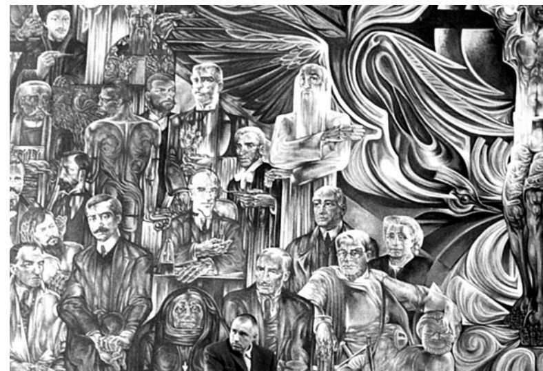
Бойко Борисов в НДК

Как с такъв елит ще имаме свой национален глас сред останалите 26 националности в Европейския съюз? Каква