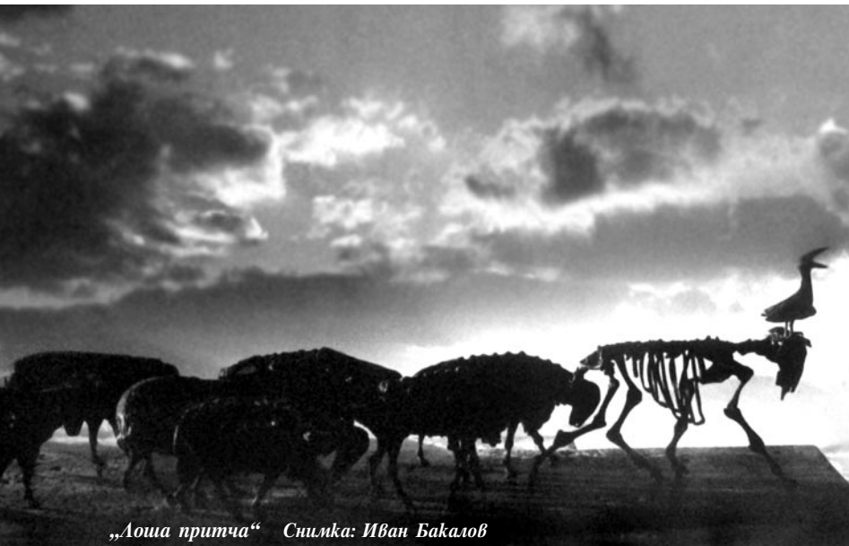
„Лоша притча“

– Една творба е толкова по-голяма, колкото повече тълкувания може да предизвика. Примерно, аз имам една работа, която се нарича „Лоша притча“. Правил съм я доста отдавна. Тя е валидна за всичкото време, в което е съществувала България. Направих я в „зрелия социа-