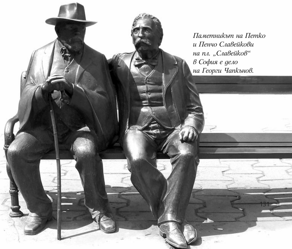
Паметникът на Петко и Пенчо Славейкови на пл. „Славейкови“ в София е дело на Георги Чапкънов.